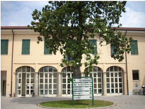
RSA Corte Cova